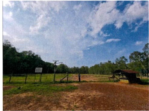
ก่อนดำเนินการสละหลุม