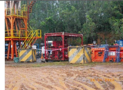
ระหว่างดำเนินการสละหลุม