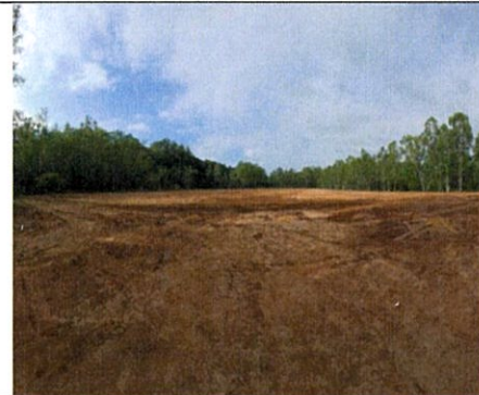
หลังเสร็จสิ้นการสละหลุม

รูปที่ 1-2 สภาพพื้นที่หลุมเจาะ SPH-1 แปลงสำรวจบนบกหมายเลข L15/43 อำเภอเขาสวนกวาง จังหวัดขอนแก่น